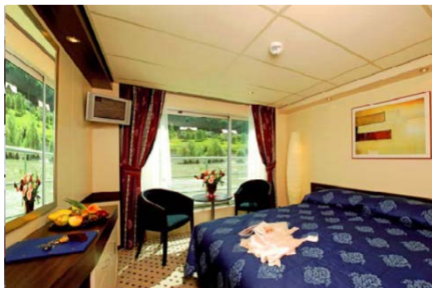
Cabina Mozart (planta superior)