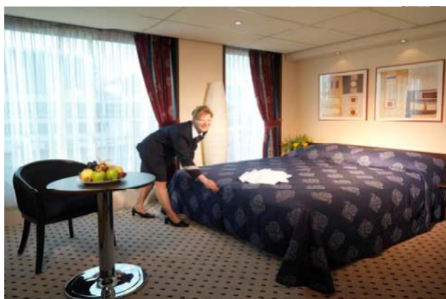
Suite Mozart (planta superior)